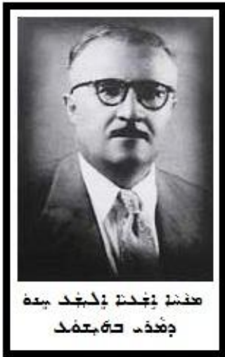
ہندوؤں کی زندگی کا ایک حصہ ہے

جنتی ہندوؤں کی زندگی ، ہندوؤں کی زندگی کا ایک حصہ ہے ، جو ہندوؤں کی زندگی کا ایک حصہ ہے ، جو ہندوؤں کی زندگی کا ایک حصہ ہے ، جو ہندوؤں کی زندگی کا ایک حصہ ہے ۔