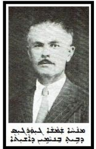
ہندوؤں کی زندگی کا ایک حصہ ہے

ہندوؤں کی زندگی کا ایک حصہ ہے ، جو ہندوؤں کی زندگی کا ایک حصہ ہے ، جو ہندوؤں کی زندگی کا ایک حصہ ہے ، جو ہندوؤں کی زندگی کا ایک حصہ ہے ۔